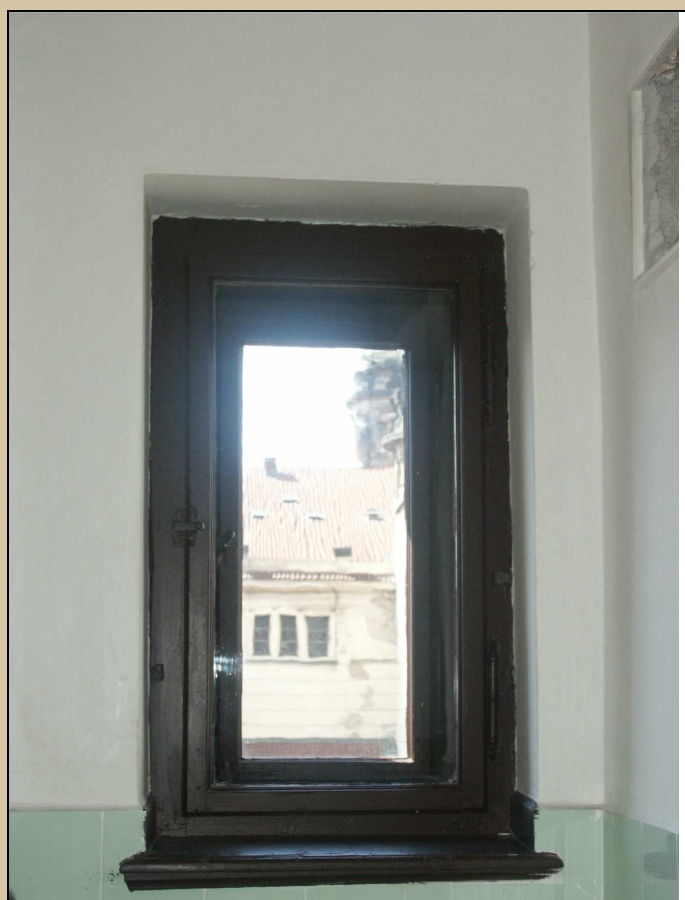
okno – celkový pohled z interiéru