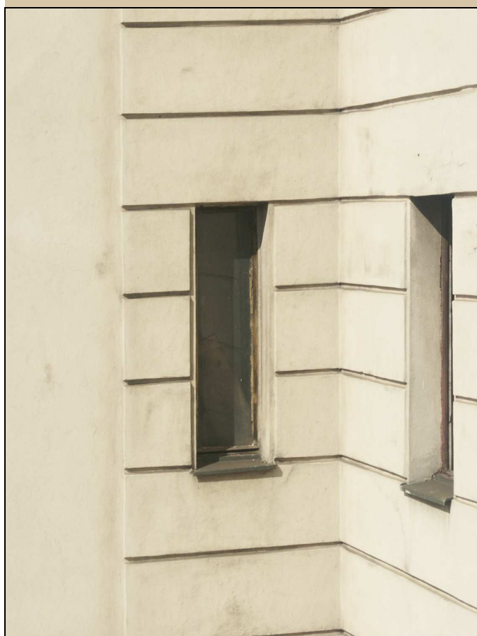
okno – celkový pohled z exteriéru